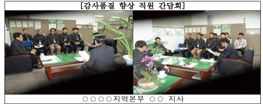
[감사품질 향상 직원 간담회]