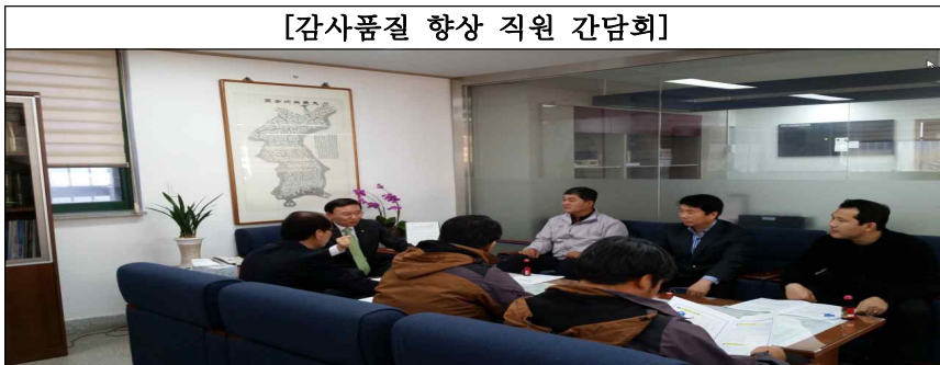
[감사품질 향상 직원 간담회]