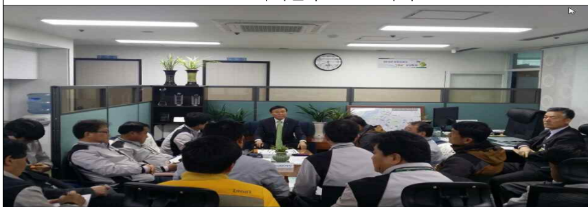
○○○○지역본부 ○○ 지사