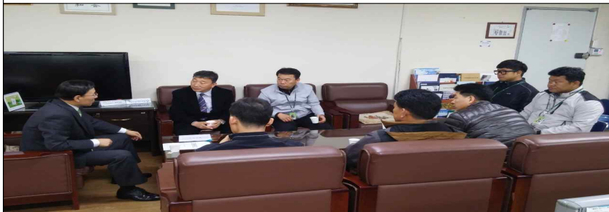
○○○○지역본부 ○○ 지사