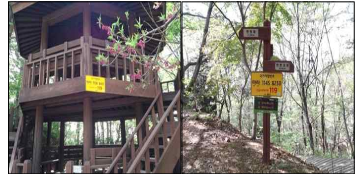
[표3] 국가지점번호판 부착 사진