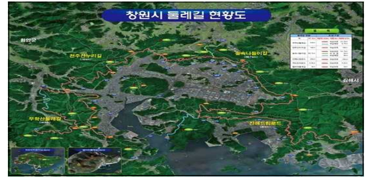
[표2] ㄷㅇ시 도레길 현황도